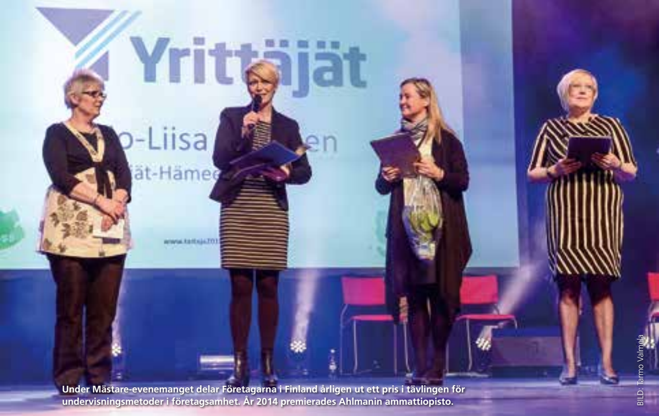
Under Mästare-evenemanget delar Företagarna i Finland årligen ut ett pris i tävlingen för undervisningsmetoder i företagsamhet. År 2014 premierades Ahlmanin ammattiopisto.