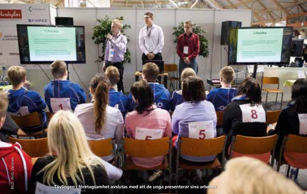
Tävlingen i företagsamhet avslutas med att de unga presenterar sina arbeten.

– Responsen är ytterst viktig för ungdomarna. Antalet lag i finalen kan inte öka längre just för att domarna bedömer alla skeden i tävlingen. De kan inte följa med hur många lag som helst.