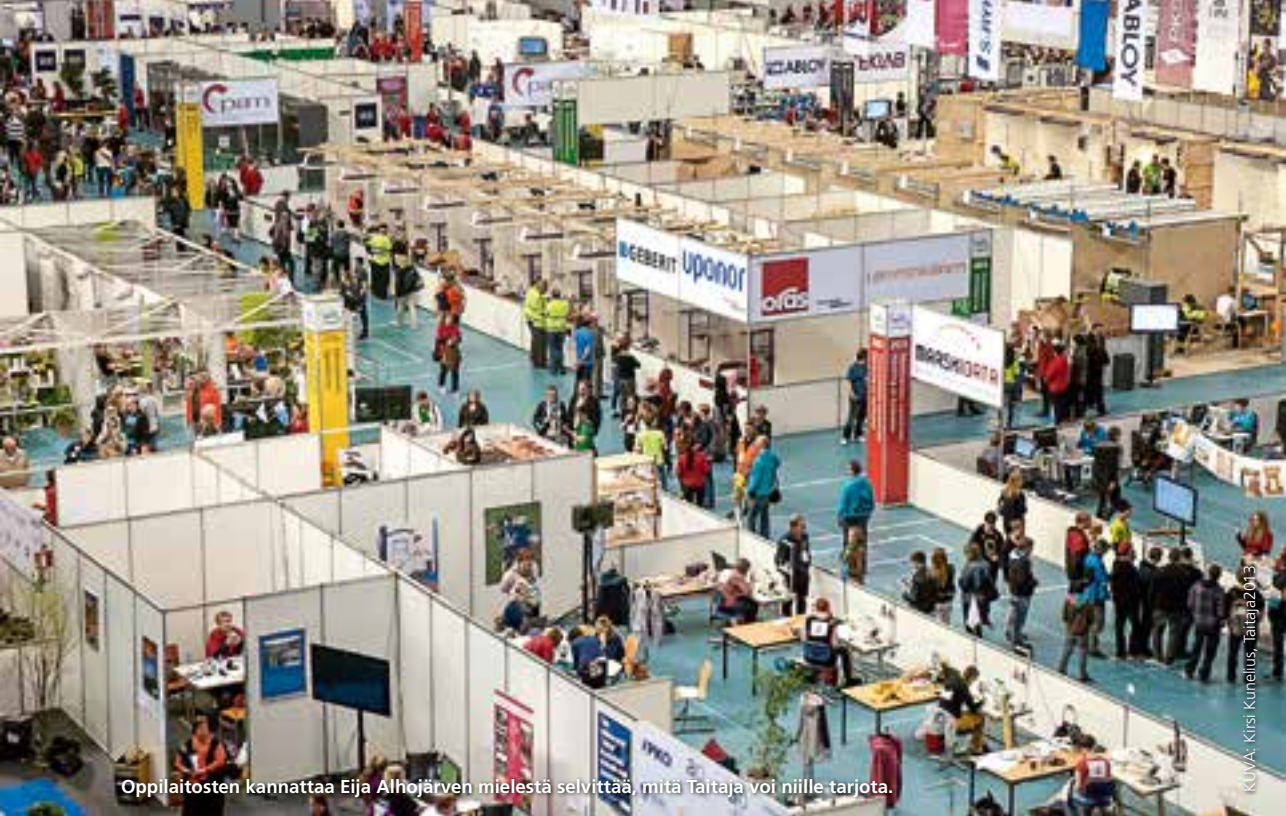
Oppilaitosten kannattaa Eija Alhojärven mielestä selvittää, mitä Taitaja voi niille tarjota.