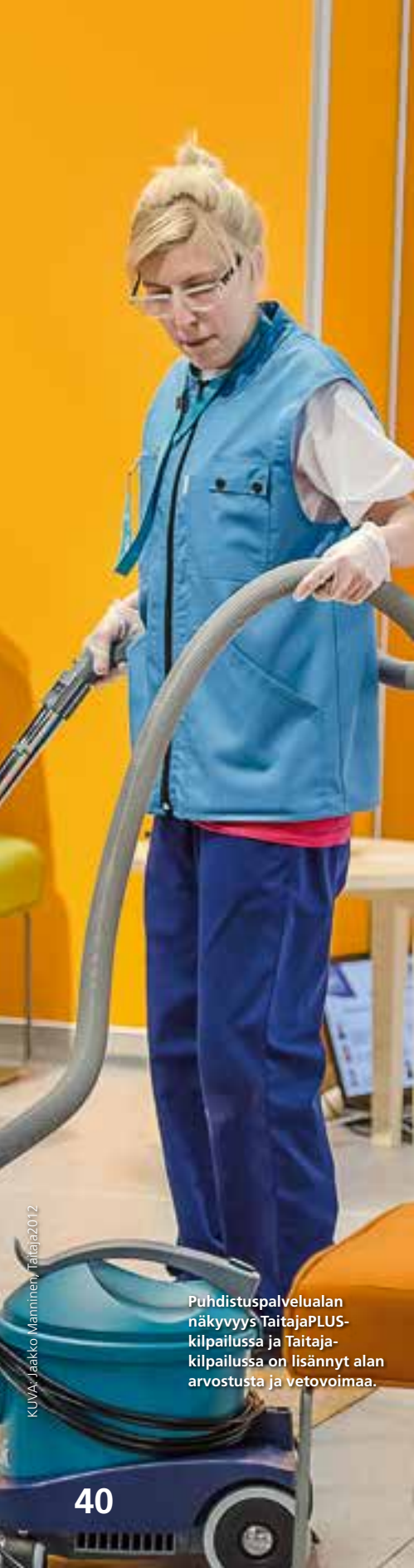
Puhdistuspalvelualan näkyvyys TaitajaPLUS-kilpailussa ja Taitaja-kilpailussa on lisännyt alan arvostusta ja vetovoimaa.