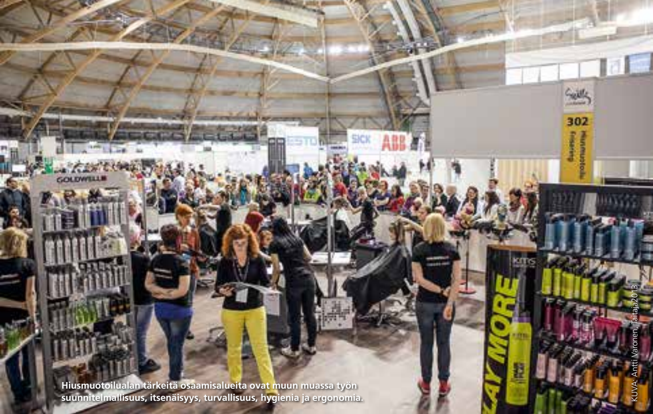
Hiusmuotoilualan tärkeitä osaamisalueita ovat muun muassa työn suunnitelmällisyys, itsenäisyys, turvallisuus, hygienia ja ergonomia.