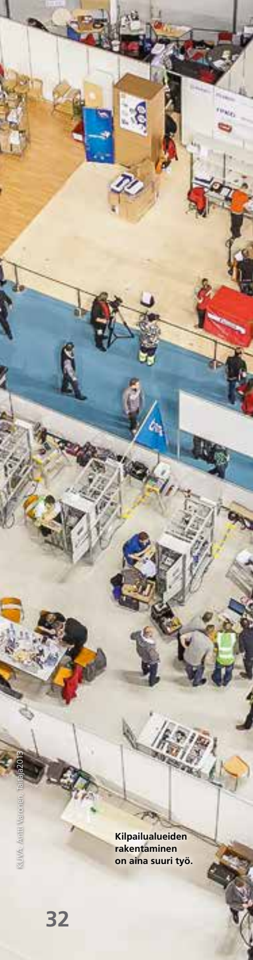
Kilpailualueiden rakentaminen on aina suuri työ.

Taitaja-tapahtumaa ei ole aiemmin järjestetty yhtä monen oppilaitoksen toimesta kuin Turun Taitaja2015 tulee olemaan.