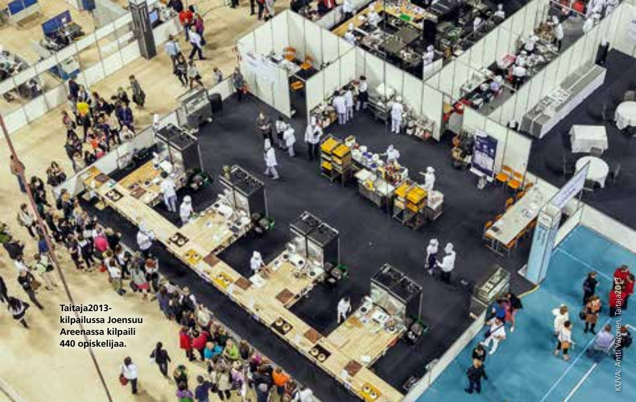
Taitaja2013- kilpailussa Joensuu Areenassa kilpaili 440 opiskelijaa.