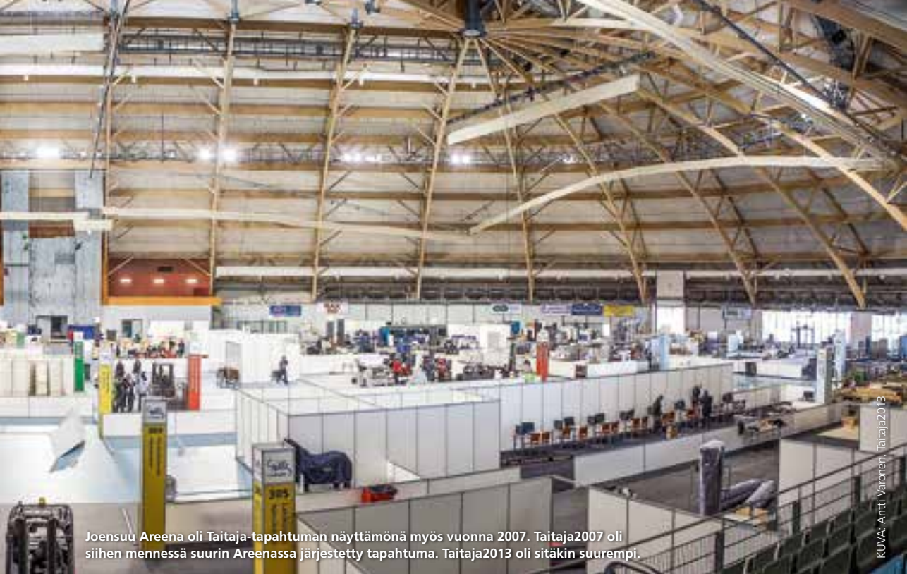
Joensuu Arena oli Taitaja-tapahtuman näyttämönä myös vuonna 2007. Taitaja2007 oli siihen mennessä suurin Arenassa järjestetty tapahtuma. Taitaja2013 oli sitäkin suurempi.