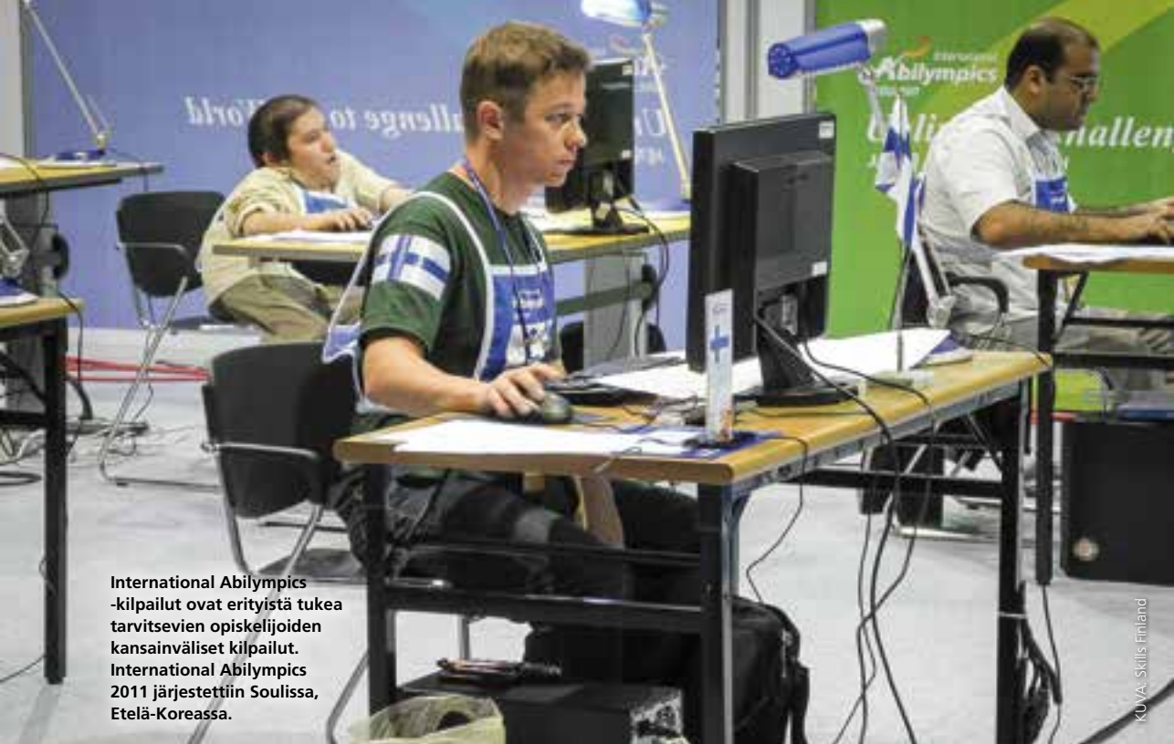
International Abilitympics -kilpailut ovat erityistä tukea tarvitsevien opiskelijoiden kansainväliset kilpailut. International Abilitympics 2011 järjestettiin Soulessa, Etelä-Koreassa.