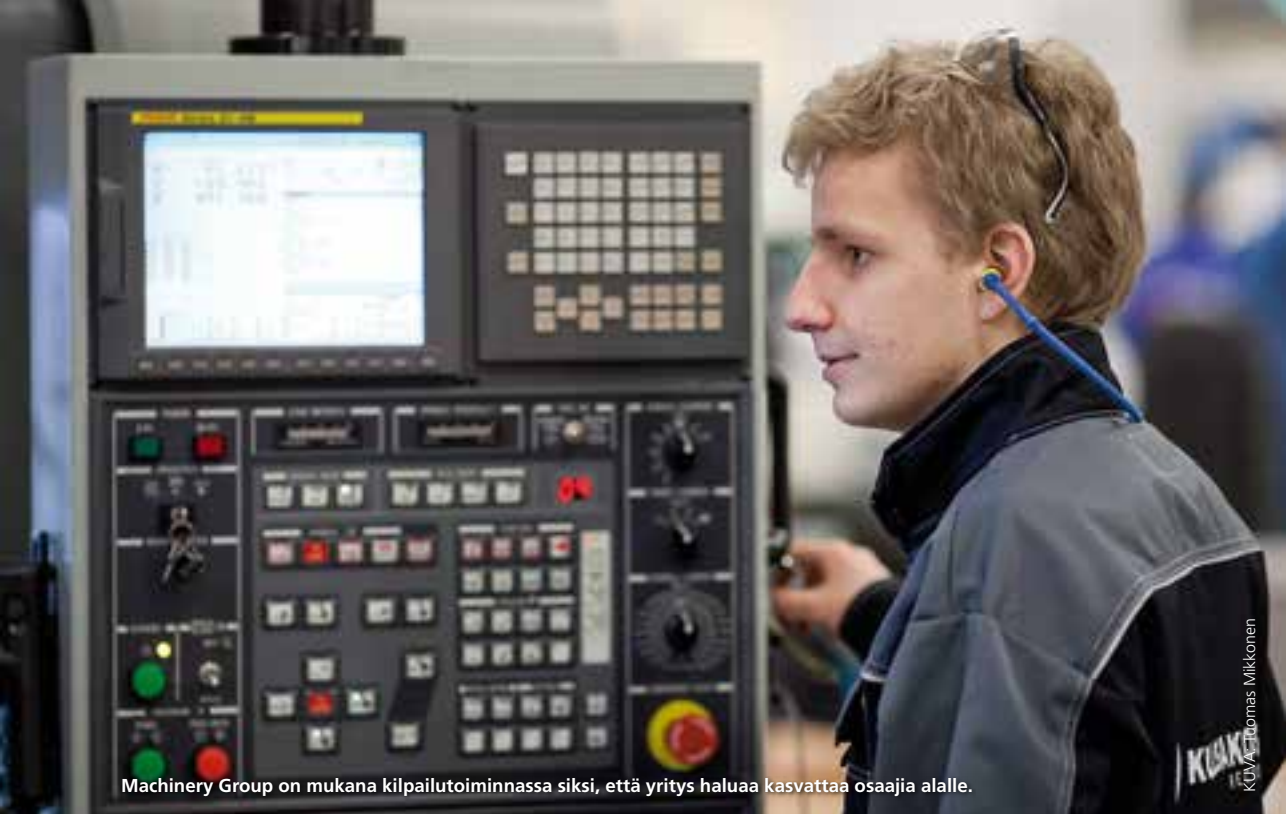
Machinery Group on mukana kilpailutoiminnassa siksi, että yritys haluaa kasvattaa osaajia alalle.

mitä metalliala ja kilpaileminen ovat. Myös yrittäjyydessä on aina mukana kilpailutilanne.