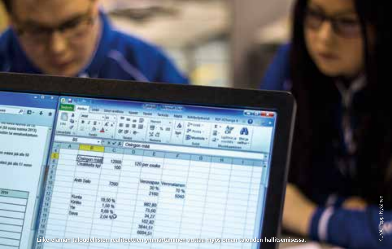
Liike-elämän taloudellisten realiteettien ymmärtäminen auttaa myös oman talouden hallitsemisessa.